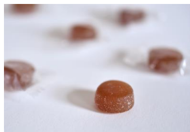
シャンピニオンゼリー・ニットーエルの商品パッケージ(左)と商品(右)